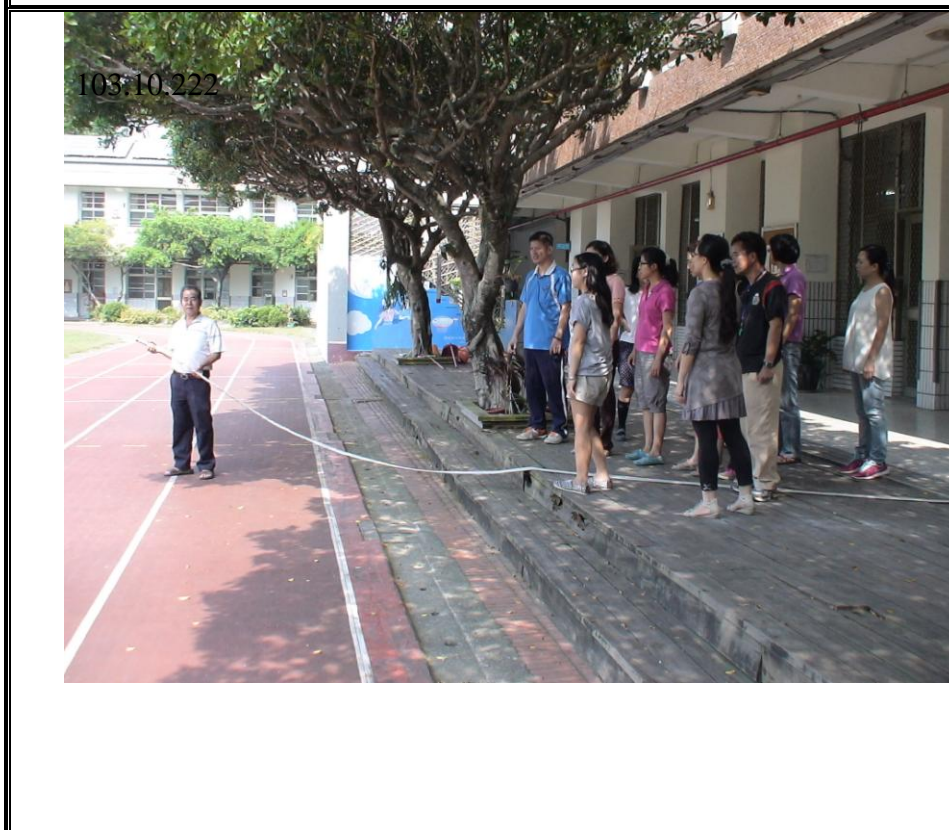
說明：消防栓使用說明演練