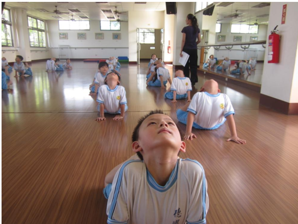
相片說明：後仰、拉筋，固定一下，不要動！