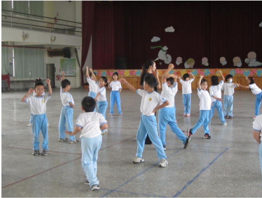
相片說明:每週三社團時間，進行混齡二~六年級兒童律動課