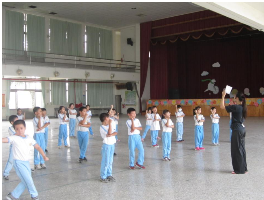
相片說明:御婷老師用心的解說律動動作