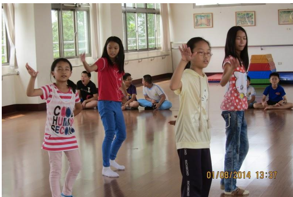
相片說明：課後照顧班的弱勢學童開心的律動