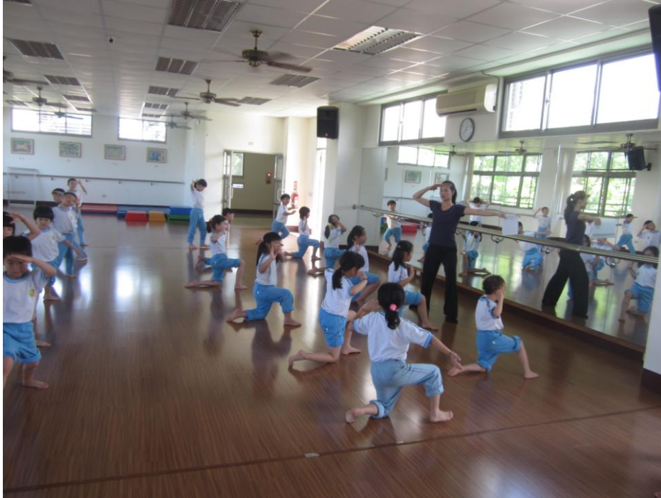
相片說明：律動營的小朋友練習著分解動作