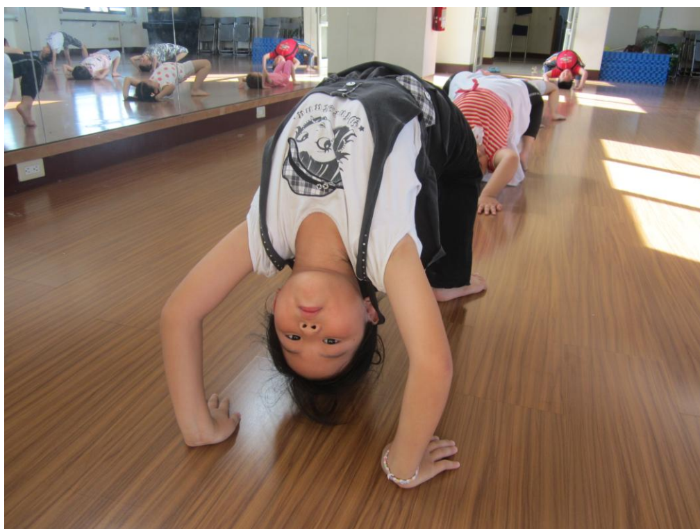
相片說明：小朋友的柔軟度真好！漂亮的後仰拱背。