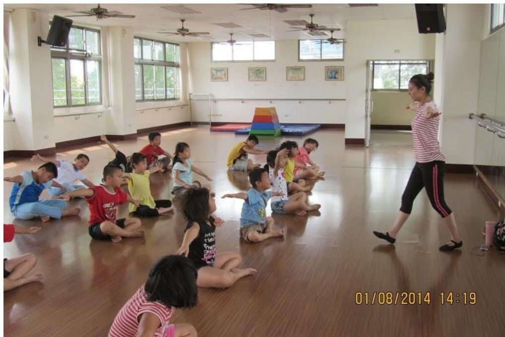
相片說明：進行暑期課後照顧班兒童律動課