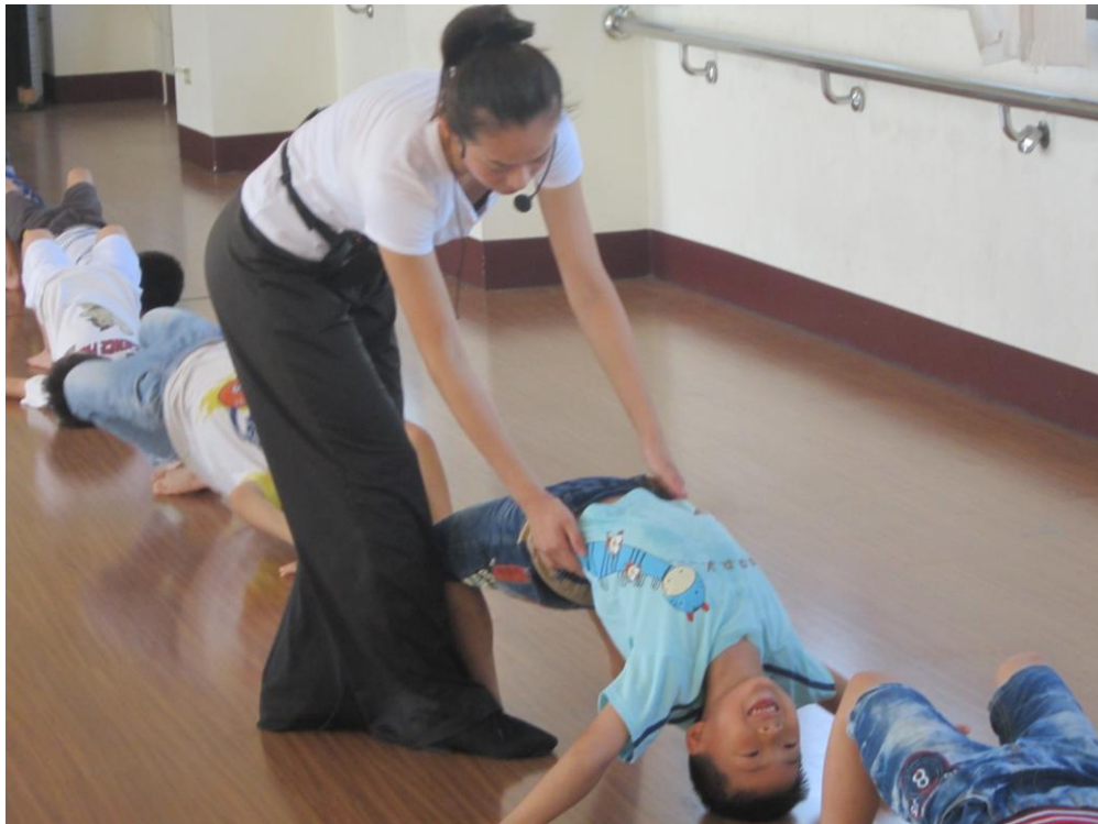
相片說明：拱背撐住！老師來調整姿勢。