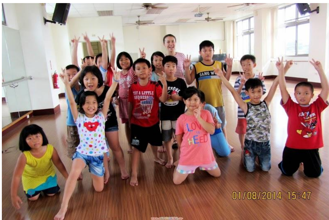
相片說明：下課了，老師和課後照顧班的學童大合照