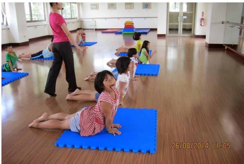
相片說明：小朋友邊練習動作邊開心的做鬼臉